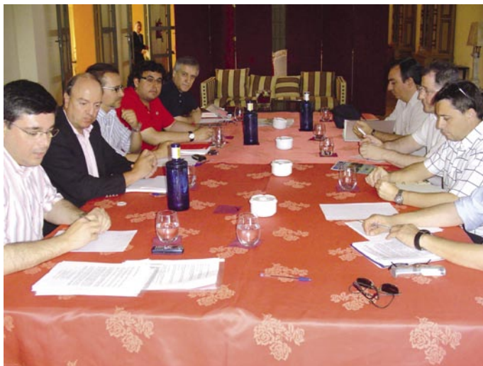
Reunión del Grupo de la Luz.

nacional en la aplicación de la interdisciplinariedad al turismo para el desarrollo de la marca 'Huelva, la Luz', una herramienta al servicio del sector turístico y la sociedad onubense para la consolidación y el desarrollo de dicha marca. Y quiere construir un discurso articulado, potente y atractivo en torno a la luz de Huelva, como vía para fortalecer el contenido y significado de la marca del destino.