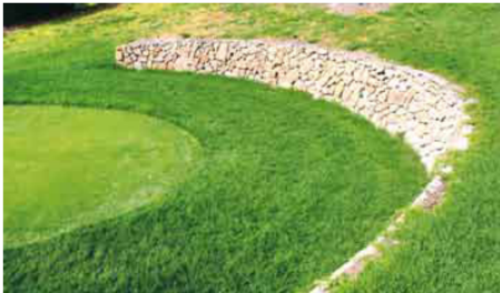
Usar diferentes tipos de césped, en función de la parte del campo, reduce el consumo.

en la zona de la Confederación Hidrográfica del Sur, donde los recursos hídricos disponibles "ascienden a 1.220 hectómetros cúbicos al año", el consumo en los campos de golf es inferior al 2%. Además afirma que el nivel de empleo, tanto directo como indirecto, que genera el consumo de un hectómetro cúbico de agua en dichos centros deportivos "es 25 veces superior al que esa misma agua genera en su consumo agrícola".