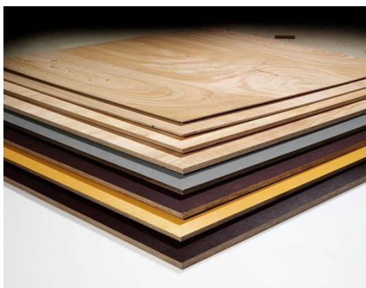
Figura 4: gama de contrachapados de eucalipto

Otros aspectos a tener en cuenta son la calidad, cantidad y tensado de los flejes y por supuesto, la característica de los pallets, que debe permitir el transporte con seguridad, y estar de acuerdo con el sentido de la carga de los contenedores, facilitando en algunos casos el arrastre en superficie.