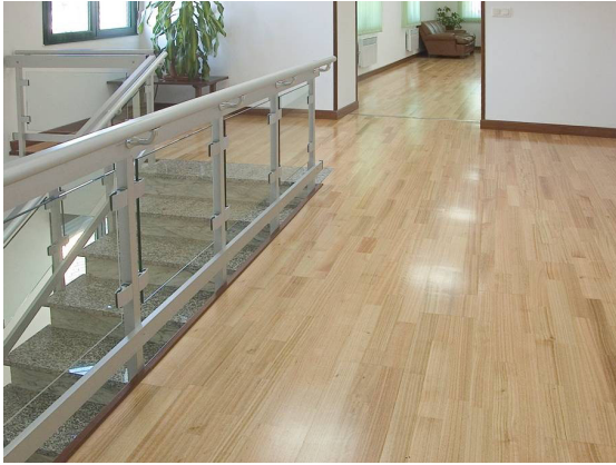
Figura 3: tarima flotante de eucalipto