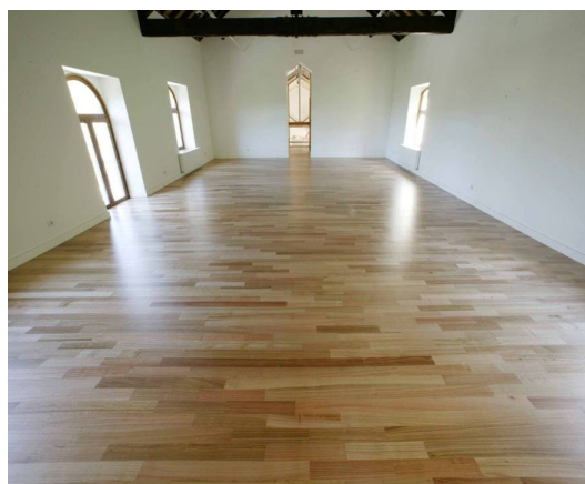
Figura 2: tarima sólida de eucalipto

Dado que la especie E.globulus cuenta con un índice de contracción e hinchamiento algo mayor que otras especies, el punto clave para su desarrollo es, desde el punto de vista del productor, el proceso de secado, y desde el punto de vista del usuario, las condiciones de instalación.