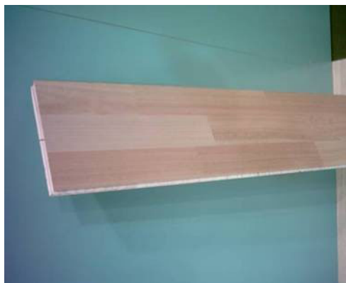
Figura 1: pieza individual de tarima flotante de eucalipto

aprovechado este desplazamiento, han permitido un crecimiento del sector y una adecuación a los niveles de calidad y exigencia europeos.