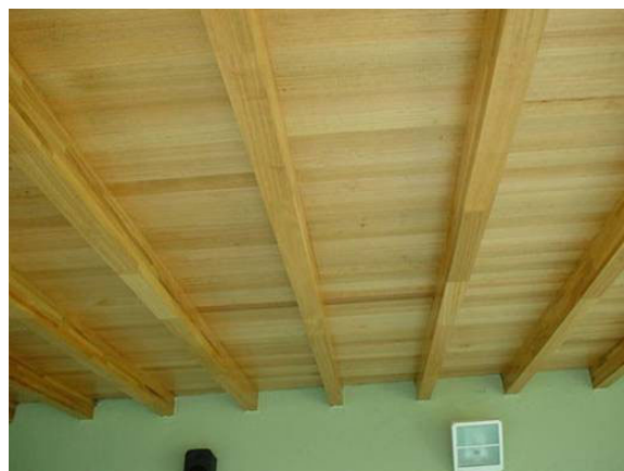
Figura 6: viga laminada de E. globulus

La escasez de madera de grandes dimensiones y las ventajas de estabilidad y acabado de las vigas laminadas hacen que éstas sean utilizadas como una herramienta frecuente para reemplazar tirantes de grandes dimensiones de otras frondosas como el Castaño en la región norte de España.