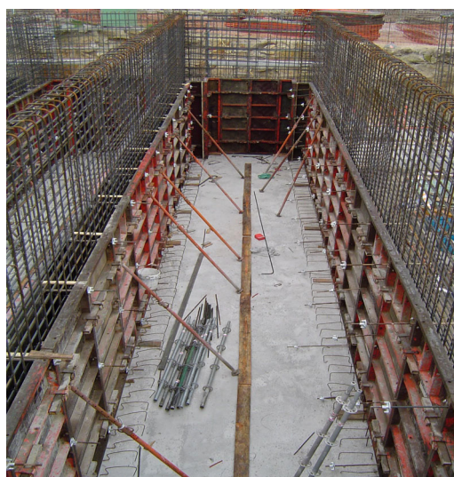
Figura 5: encofrado

Dada la escasez de productos de alta resistencia, el futuro de este sector está en el desarrollo de otros productos con requerimientos técnicos específicos.