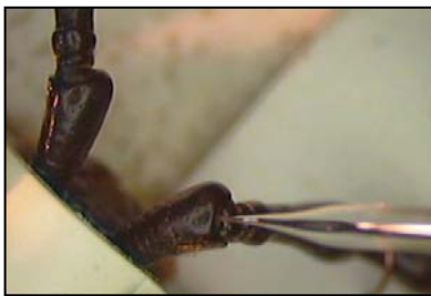
Foto 3: Detalle de inserción de electrodo de referencia en antena de C. welensii .

Tanto C. welensii como P. germari manifiestan aptitud para los estudios electroantenográficos (Sánchez et al. , 2004; Sánchez-Osorio et al. , 2005; Sánchez-Osorio et al. , 2006). Los primeros resultados en esta línea indican que ambas especies detectan olfativamente al menos 16 sustancias volátiles considerada propias del espectro de emisión de especies típicamente hospedantes ( Q. ilex y Q. suber ) o de especies no hospedantes ( Pinus spp., Eucalyptus spp.). En particular, ambos xilófagos detectan con intensidad la mayoría de monoterpenos de emisión principal por las dos fagáceas. Esto permite abordar futuros trabajos que analicen la capacidad de los principales estimulantes olfativos de ambos cerambícidos para condicionar ciertos hábitos de su comportamiento, en particular los asociados a la localización de hospedantes. Esta posibilidad abre interesantes perspectivas considerando los presupuestos respecto a la viabilidad de las propuestas de control en el contexto del Manejo Integrado de Plagas.