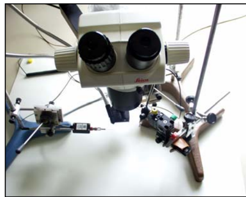
Foto 2: Dispositivo para el estudio de la respuesta electroantenográfica.

medidas con cierto potencial. Para el planteamiento de tales medidas en términos de Control Integrado hay que resaltar algunas cuestiones importantes, relacionadas con el comportamiento de estas especies, su papel dentro del ecosistema –en particular las dehesas- y su situación normativa. Las medidas tradicionales de naturaleza selvícola y de ordenación (Moral et al. , 1989 y 1994; Naveiro y Morcuende, 1994), encaminadas al rejuvenecimiento de la arboleda resultan