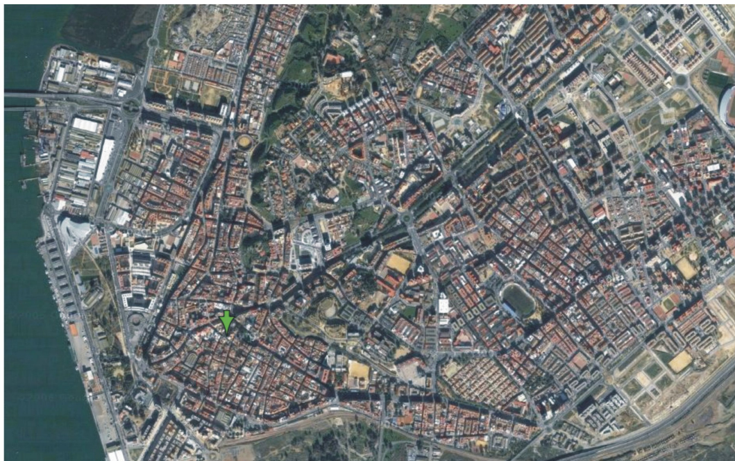
Lámina 1: Plano de ubicación del solar.