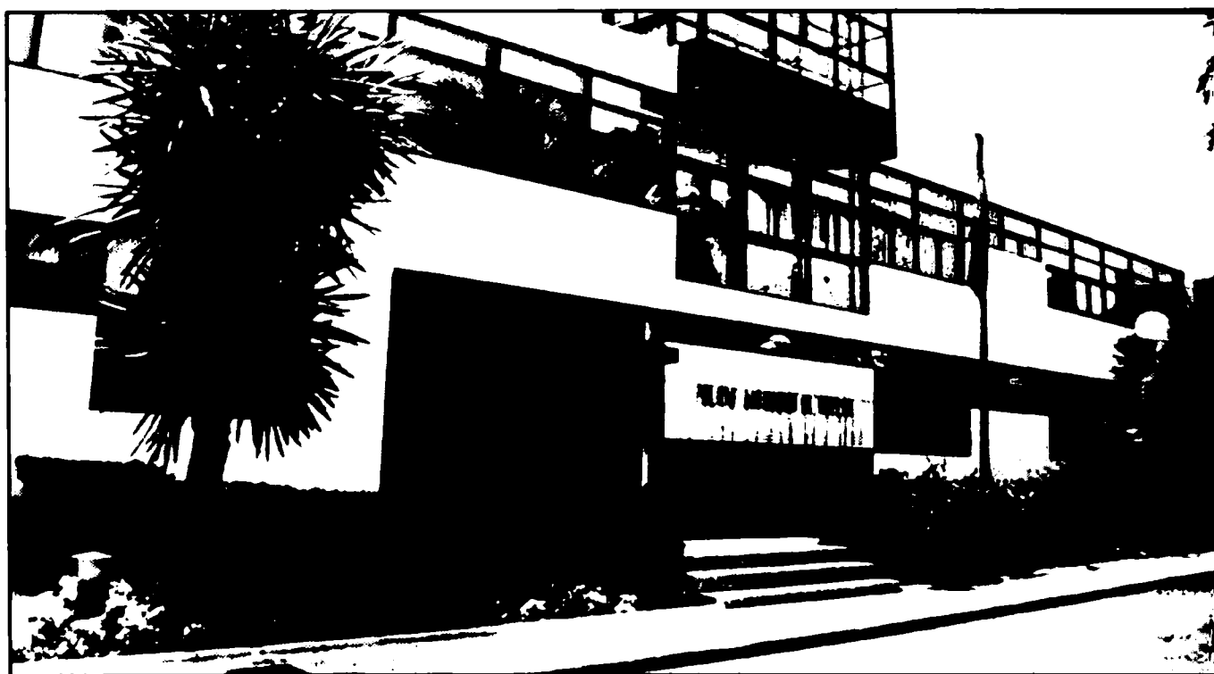
Fot. 1.- Edificio de oficinas de la Autoridad Portuaria de Huelva

El Archivo de la Autoridad Portuaria de Huelva se encuentra instalado en las oficinas de dicha Entidad, que se hallan situadas en Huelva capital, en la Avenida Real Sociedad Colombina Onubense, s/n, a pocos metros de la entrada al Muelle de Levante.