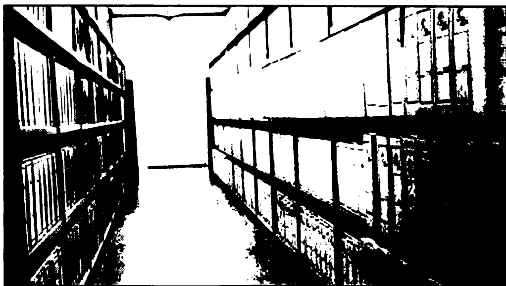
Fot. 3.- Fondo documental del Archivo de la Autoridad Portuaria de Huelva

Al final del artículo presentamos la Tabla de clasificación del Fondo documental del Archivo que nos ocupa, la cual nos puede dar una idea más clara, al menos, para entender los grandes grupos documentales que podemos encontrar en nuestra Entidad.