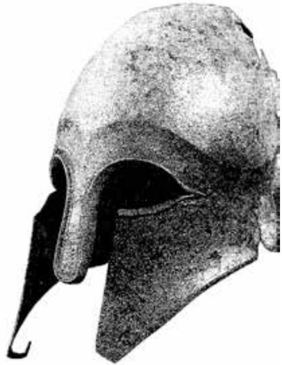
Figura 1. Casco griego recuperado en la ría de Huelva (según Blázquez y García Gelabert, 1997, 106).

Con serias dudas sobre su ubicación, E. Llobregat (1963) divulga en el VIII Congreso Nacional de Arqueología el estudio de una espada onubense so-