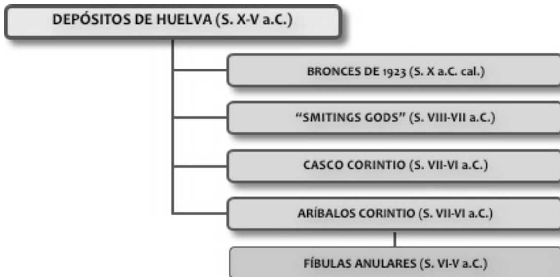
Figura 7. Cronología general de los hallazgos encontrados en la ría de Huelva.

e) La descripción del contexto arqueológico del hallazgo, encontrado a bastante profundidad y sellado entre una capa de aluviones modernos por arriba y otra de arcilla estéril abajo, dentro de un perímetro relativamente reducido, indica la contemporaneidad de la deposición fluvial y, por consiguiente, la posibilidad de que se trate del hundimiento y el cargamento de un barco.