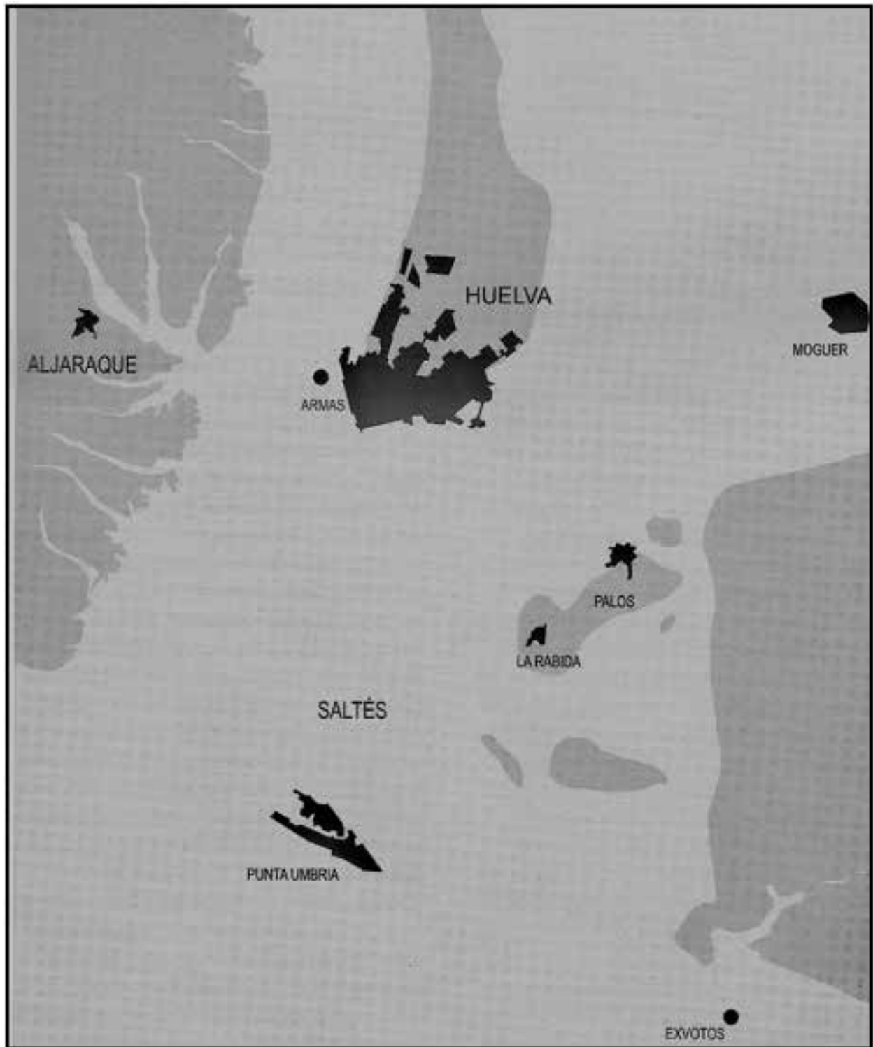
Figura 4. Estuario de los ríos Tinto y Odiel en la Protohistoria, con la situación del depósito de 1923 y otros objetos arrojados a sus aguas (Fernández Jurado, 2005, 743, figura 6).