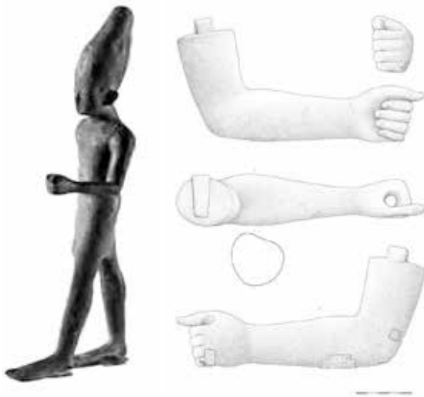
Figura 3. A la izquierda, "smiting god" procedente de la ría de Huelva; a la derecha, restos de un brazo de bronce de la colección Albelda, perteneciente a otro "dios que golpea"; pudo haber sido recuperado también del fondo de la ría onubense (según Ferrer, 2012).

de los fondos de la ría onubense. Se trata de un brazo de bronce que formó parte de la representación de un "smiting god" de gran peso (cerca de los 50 kg) y tamaño (en torno a 1 m) (figura 3). El segundo bronce se encuentra en paradero desconocido, si bien sabemos que fue hallado durante la construcción de la Refinería de Petróleos de Torre Arenillas, en el polo industrial de Huelva. Dispondríamos, pues, de al menos cuatro ejemplares en total (Ferrer, 2012).