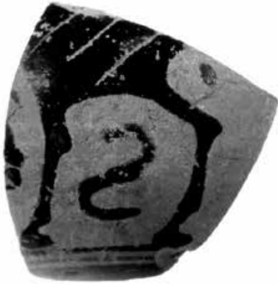
Figura 2. Fragmento de cerámica corintia hallada de forma casual en la ría de Huelva.