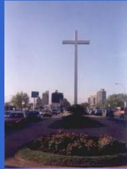
Los ejes cartesianos tienen religión