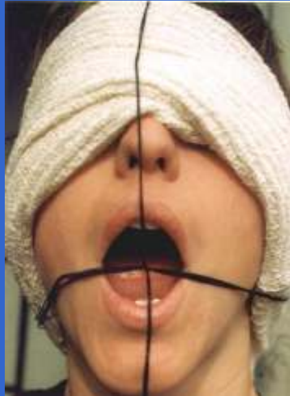
Si giro la boca por la intersección de hilos ¿qué pasará?