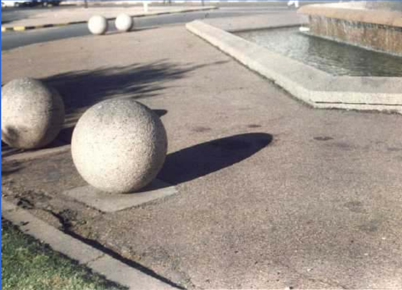
Óvalo movido por el Sol