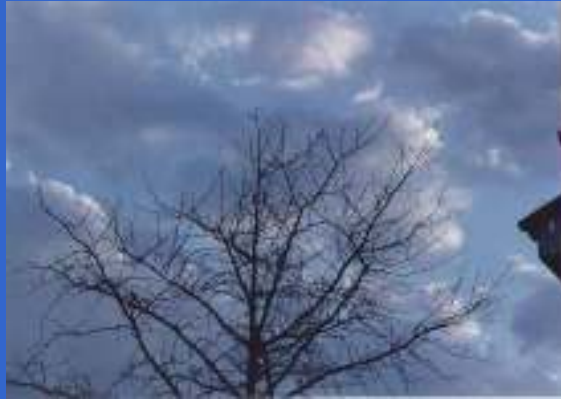
Digrama de Árbol