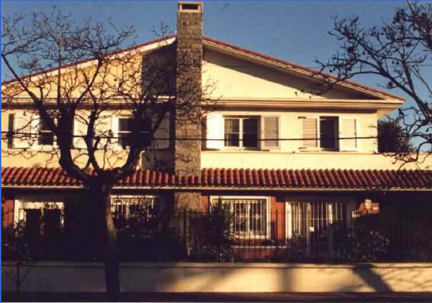
Vecinos por la Simetría