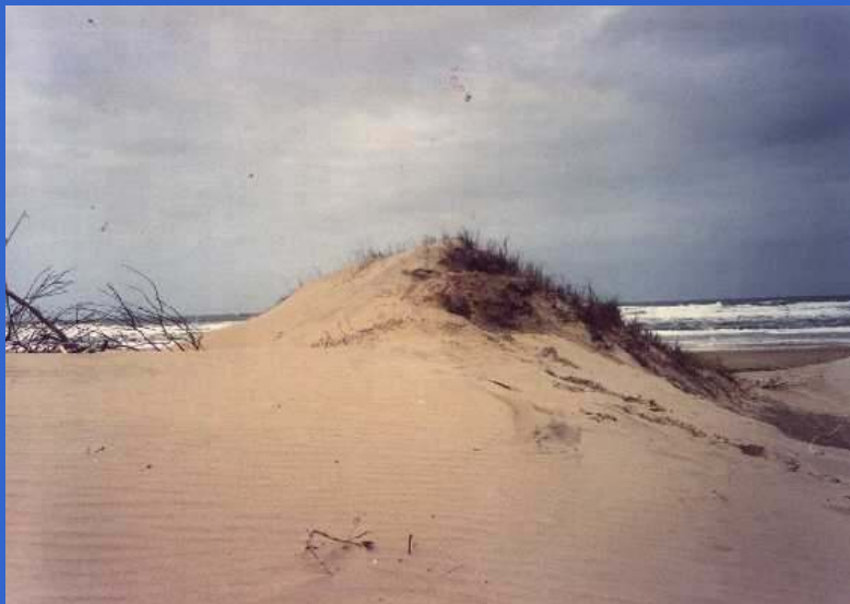
Balneario normal según Gauss