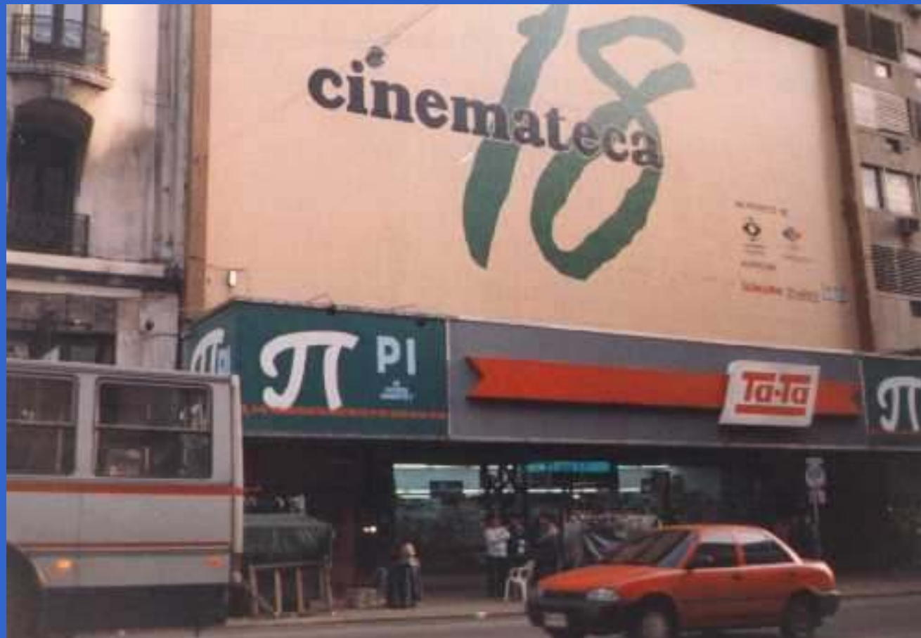
Películas de rodaje 3,14