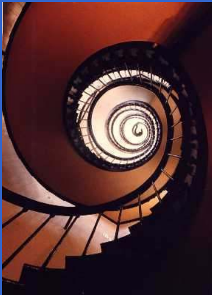
Finito o Infinito