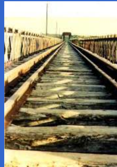
Perspectiva hacia la estación