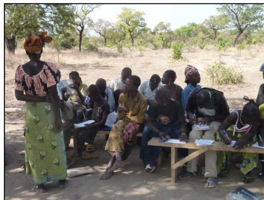
Imagen 2. Alfabetización en los poblados

Las tres organizaciones que han trabajado conjuntamente, aportando cada una su experiencia en el ámbito específico de su trabajo, están construyendo una red de mujeres asociadas, que poco a poco van pasando de “clientes” de los microcréditos a miembros activos de su propia estructura organizativa, responsables de la gestión de sus recursos, formadoras y soporte para otras mujeres necesitadas. Creando grupos propios que se autodenominan Asociación de Mujeres Autogestionarias (AAA) . Actualmente existen 12 grupos, que llegan a “movilizar” a unas 6000 mujeres, 6 en la región de Kayes, 3 en la región de Gaoua y 3 en la región de Tambacounda. A medio plazo estos grupos tienen el objetivo de ser financieramente independientes, gracias a la adquisición de habilidades técnicas y de gestión y a la constitución de capital propio, generado por las cotizaciones de sus miembros y los beneficios de las actividades colectivas realizadas. Por ejemplo la AAA de la aldea de Hello, a unos 20 Km de Gaoua, gestiona un huerto, la de Kotiary, población próxima a Tambacounda, gestiona un mercado semanal.