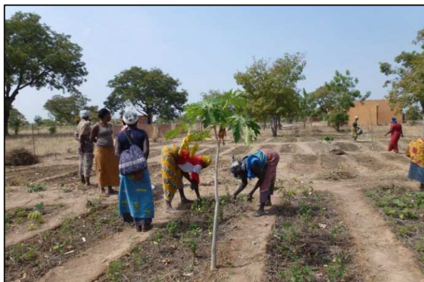
Imagen 1. Huerto colectivo de Hello.

familiar. En las Imágenes 1 y 2 se pueden observar algunas de las actividades antes mencionadas.