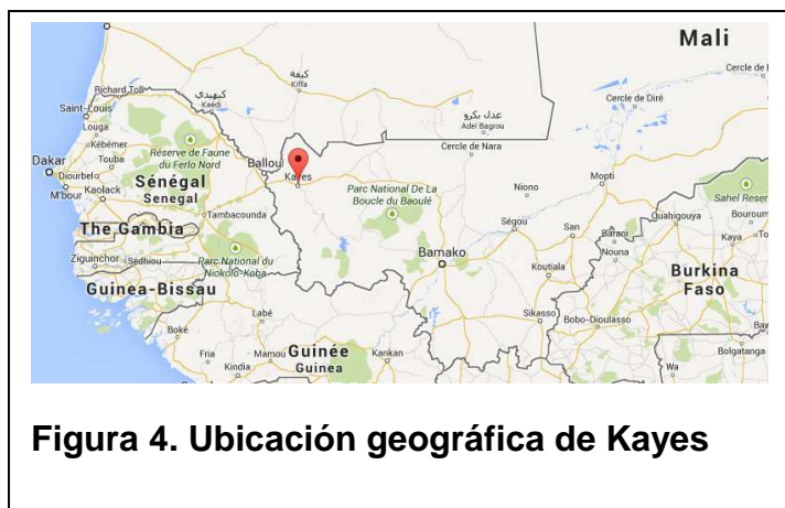
Figura 4. Ubicación geográfica de Kayes