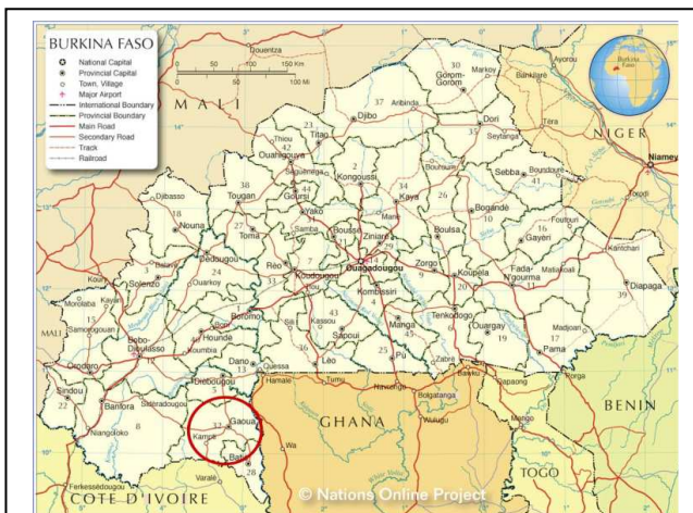
Figura 2. Ubicación geográfica de Gaoua

Esta asociación surgió de un grupo de madres de alumnos inquietas por mejorar la escuela y por sus propias dificultades cotidianas como mujeres. Paso a paso ha ido extendiendo su acción, consolidando su presencia. De la radio local a las reuniones en los poblados más apartados. Desde el teatro fórum a las jornadas de sensibilización con madres de distintas escuelas. De la denuncia de la práctica de la ablación hasta la reconversión de las matronas que la practicaban a otros oficios y