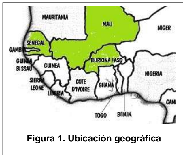
Figura 1. Ubicación geográfica

Se trata en los tres casos de Asociaciones locales, en un medio, África del oeste, en el que hay muchos elementos comunes que preocupan y condicionan la vida cotidiana: pobreza, inmigración, deforestación, difícil acceso al agua, una misma lengua oficial el francés, ablación, analfabetismo endémico entre las mujeres... Tres asociaciones empeñadas en buscar vías y acciones para mejorar el día a día, por conseguir la sostenibilidad de sus acciones, de sus proyectos desde la perspectiva de apostar por un desarrollo sostenible y duradero, que asegure su viabilidad e independencia... Tres actores locales que conocen bien el medio en que actúan cada cual, sus lenguas maternas, sus estructuras y organizaciones sociales, las relaciones de poder y dominación que hay que afrontar en los poblados para que las mujeres puedan acceder a la tierra, los factores que dificultan la desaparición de la mutilación sexual femenina, los elementos que hay