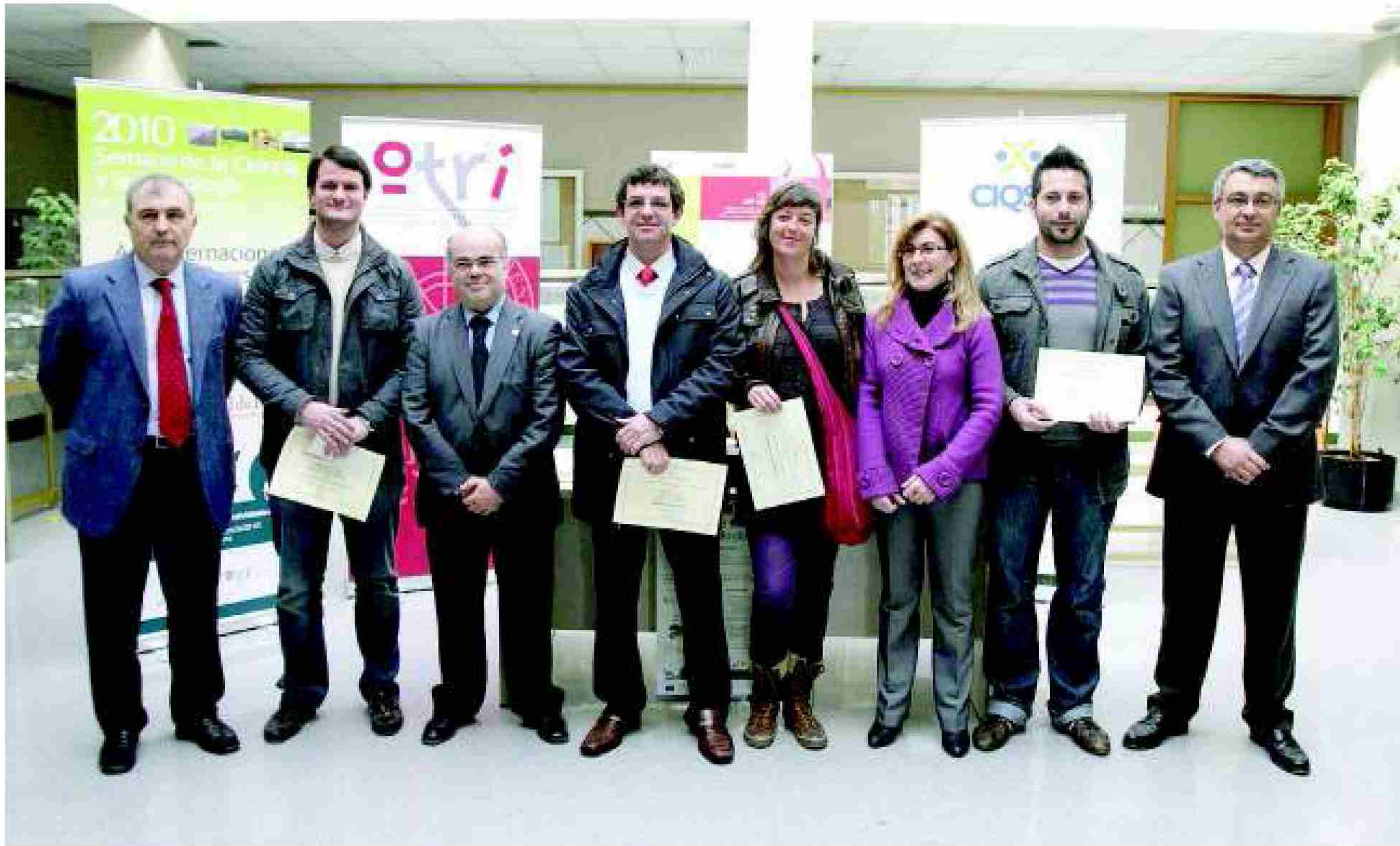
Foto de familia de los premiados en la Semana de la Ciencia y la Tecnología 2010