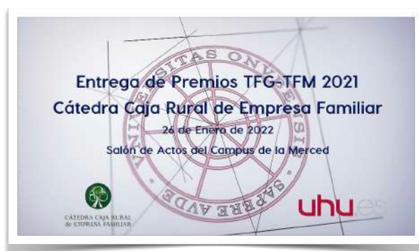
Vídeo de la entrega de los Premios CEF TFG y TFM 2022