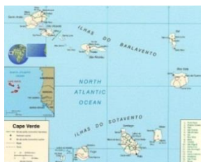
Mapa. 6- Cabo Verde

El archipiélago de Cabo Verde está formado por un conjunto de islas situado en el Océano Atlántico, al sur de las islas Canarias, frente a las costas de Senegal. El archipiélago comprende diez islas (San Antón, San Vicente, Santa Lucía, San Nicolás, Sal, Buena Vista, Mayo, Santiago, Fuego, Brava) y un conjunto de pequeños islotes (Blanco, Raso y Secos). Su superficie es de 4.033 Km 2 , la población de 1970 era de 272.072 habitantes y el 80 por ciento de la población era mestiza, el 19 por ciento africana y el 1 por ciento europea. El clima subsahariano hacía poco viable la agricultura por lo que muchos caboverdianos tuvieron que emigrar, en un principio a Angola, Senegal, Santo Tomé y Príncipe y a los EE.UU. y en los años setenta a Portugal. Los ciudadanos de Cabo Verde siempre fueron considerados ciudadanos portugueses igual que los de la metrópolis 112 .