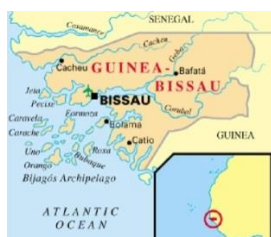
Mapa. 4- Guinea-Bissau

Guinea- Bissau está situada en la costa occidental de África y tiene una superficie de 36.125Km 2 . Está compuesta por una parte continental con sus islas adyacentes (las más importantes son Bissau, Boloma y Pecixe) y por el archipiélago de las Bijagos. El censo de la población en Guinea en 1970, bajo control de las autoridades