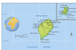
Mapa. 7- S. Tomé y Príncipe

El archipiélago de Santo Tomé y Príncipe se encuentra situado en el golfo de Guinea, frente a las costas de Gabón. Está compuesto por las islas de Santo Tomé y Príncipe y los islotes: Rolas, Cabras, Santana, Piedra da Galé, Bombom, Boné Jóquei y Piedras Tiñosas. Su superficie es de 1.001 Km 2 . La economía era por un lado la de subsistencia y por el otro estaba la de grandes plantaciones, esta última ocupaba el 90 por ciento de la isla y se tenía que emplear mano de obra foránea, principalmente de Cabo Verde y además de Angola y de Mozambique, la actividad económica se basaba en la exportación de cacao, copra, café, aceite de palma, etc. La población autóctona se