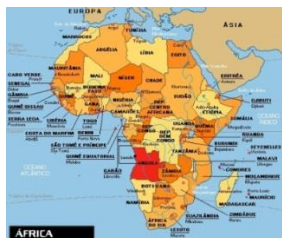
3. Mapa. Angola

Angola ocupa un área de 1.246.700 km 2 , incluyendo la superficie del enclave de Cabinda. Tiene un subsuelo rico en petróleo, diamantes, hierro, cobre, oro, plomo, cinc, manganeso, volframio, estaño, uranio, etc. El sistema económico colonial estaba basado en la explotación del trabajo indígena, este, se mantendría vigente hasta mediados del siglo XX. El sector agrícola ocupaba al 85% de la población, tenía una agricultura de subsistencia, que estaba en manos de medios blancos locales y metropolitanos. Una pequeña parte se dedicaba a la exportación de café, algodón y sisal. La industrialización no tendría un repunte hasta la década de los sesenta, y estaría principalmente en manos de capital extranjero 82 .