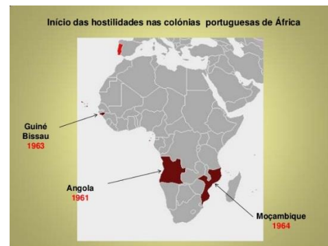
Mapa. 2- Inicio de hostilidades en las colonias

En la Primera Guerra Mundial habían nacido unos movimientos independentistas de sus antiguos imperios coloniales, pero cuando se produjo la Segunda Guerra Mundial estos movimientos se fortalecieron. El imperio colonial portugués no sigue el mismo ritmo descolonizador que el resto de Europa. Los países anglosajones fueron los que menos oposición les pusieron a sus colonias a independizarse: Filipina lo hizo de EE.UU. en 1946, la India 58 de Gran Bretaña en 1947. Más conflictivo fue el caso de Palestina e Israel, donde terminó dividiéndose Palestina en una zona árabe y otra judía, el problema sigue existiendo hasta la actualidad. Desde 1957 y 1965 casi todas las antiguas colonias de África habían conseguido la