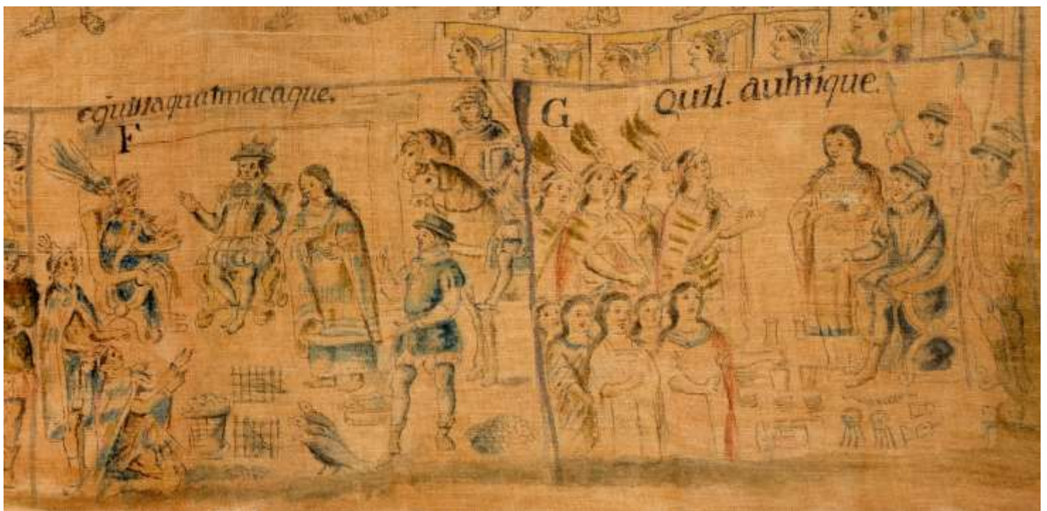
Manuel Yllañes, J., (1773) Lienzo de Tlaxcala No.1 Lámina 1. Exposición Códices de México, Memorias y Saberes.

Esta representación de Malinalli junto al conquistador con las manos señalando hacia los indígenas y los españoles será una constante a lo largo del Lienzo, como podemos observar en dos escenas de la lámina 1.