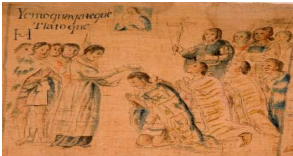
Manuel Yllañes, J., (1773) Lienzo de Tlaxcala No.2 Lámina 1. Exposición Códices de México, Memorias y Saberes.

de los cuatro gobernantes a la religión católica. La figura de Malinalli en este caso se entiende como partícipe de la temprana integración en el seno de la comunidad católica de los cuatro gobernantes de Tlaxcala que reciben el sacramento del bautismo y abrazan el catolicismo.