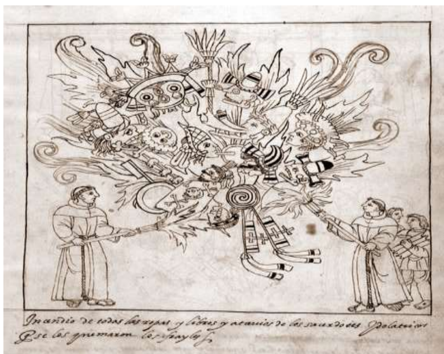
Diego Muñoz Camargo (1580) Manuscrito de Glasgow . Fol. 239 v. Franciscanos queman códices, vestidos y máscaras de los dioses. Pueblos originarios. Colecciones pictóricas y fotográficas

a la perfección la quema de libros, además puede leerse, “ incendio de todas las ropas y atavíos idólatricos, que se los quemaron los frailes ”.