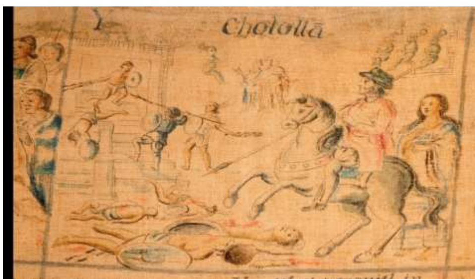
José Manuel Yllañes (1773) Lienzo de Tlaxcala No.2 Lámina 4. Exposición Códices de México, Memorias y Saberes.

Otra lámina en que adquiere notable importancia Malinalli es en la número 4 del fragmento 2, donde se representa la Matanza de Cholula, apareciendo esta india de cuerpo entero, arriba a la derecha del jinete español que con su corcel aplasta los cadáveres cholultecas, con una mano extendida y señalando al templo de la ciudad siendo asaltado por un español y un tlaxcalteca (ejemplo de esa alianza). Que Malinalli aparezca representada así puede deberse a una reminiscencia del “rol que desempeñó” en dicha matanza, ya que como hemos comentado con anterioridad, ella fue “quien se enteró” del complot a través de una anciana y se lo comunicó al conquistador.