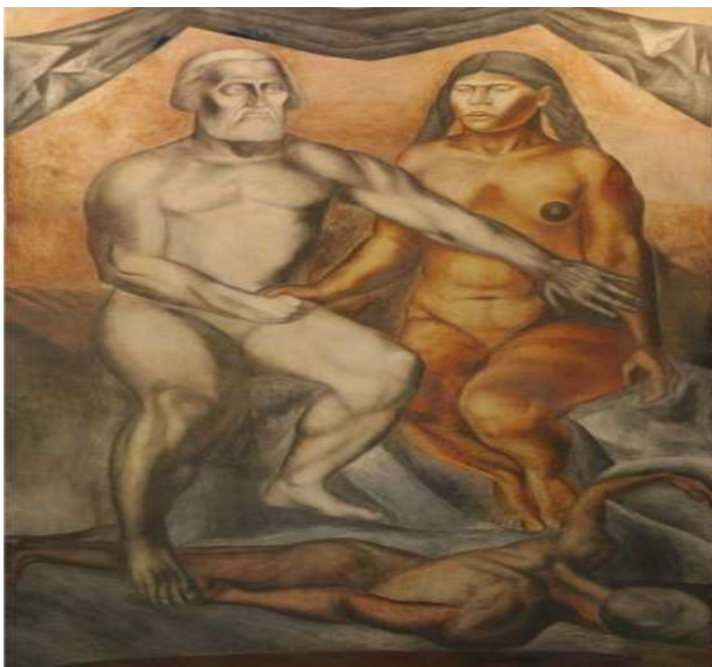
Clemente Orozco, J., (1883 - 1949) Cortés y La Malinche , 1926. Fresco. Colegio San Idefonso, México.

La visión del mestizaje representado por Malinalli y Cortés, como la fusión de dos culturas, y el producto de esa relación, el “primer mestizo”, el origen del pueblo mexicano, se ve plasmada en una obra de José Clemente Orozco, Cortés y la Malinche (1926)