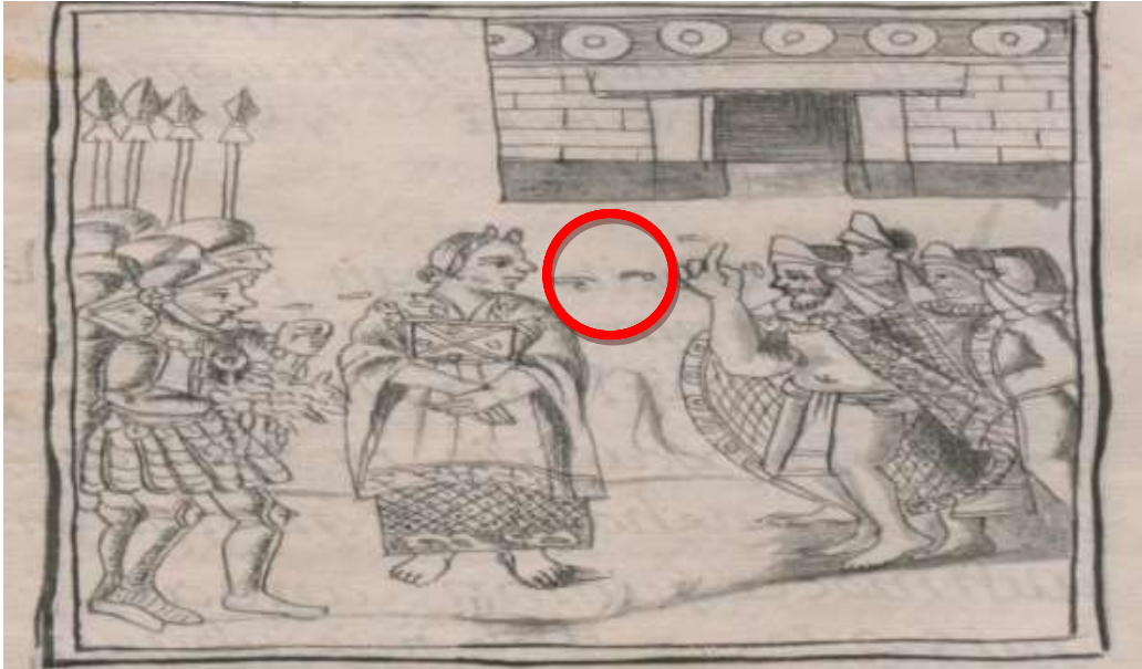
Sahagún, B., (1577) Historia general de las cosas de Nueva España Libro XII. Cap. 16. p. 55. Biblioteca Digital Mundial.