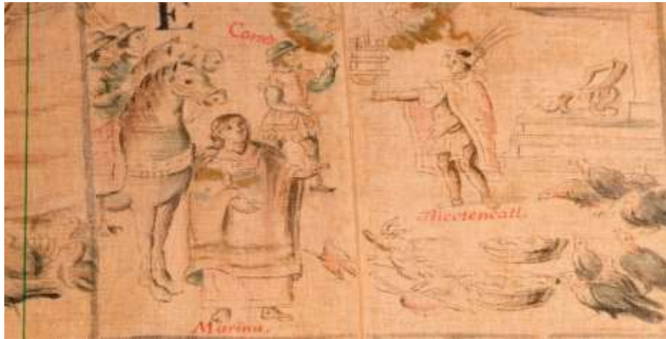
Manuel Yllañes, J., (1773) Lienzo de Tlaxcala No.2 Lámina 9. Exposición Códices de México, Memorias y Saberes.

Esta representación de Malinalli junto al conquistador con las manos señalando hacia los indígenas y los españoles será una constante a lo largo del Lienzo, como podemos observar en dos escenas de la lámina 1.