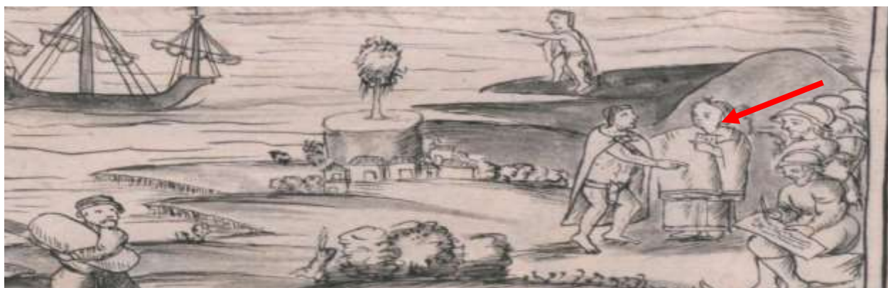
Sahagún, B., (1577) Historia general de las cosas de Nueva España Libro XII . Portada. Biblioteca Digital Mundial.