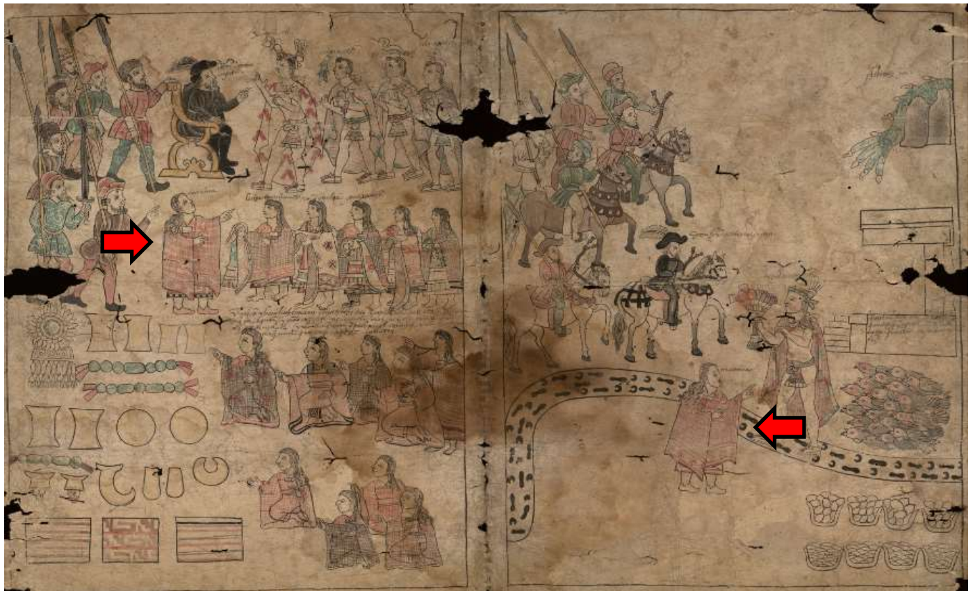
Fragments de Texas (1530-1540) Biblioteca Digital Mexicana.