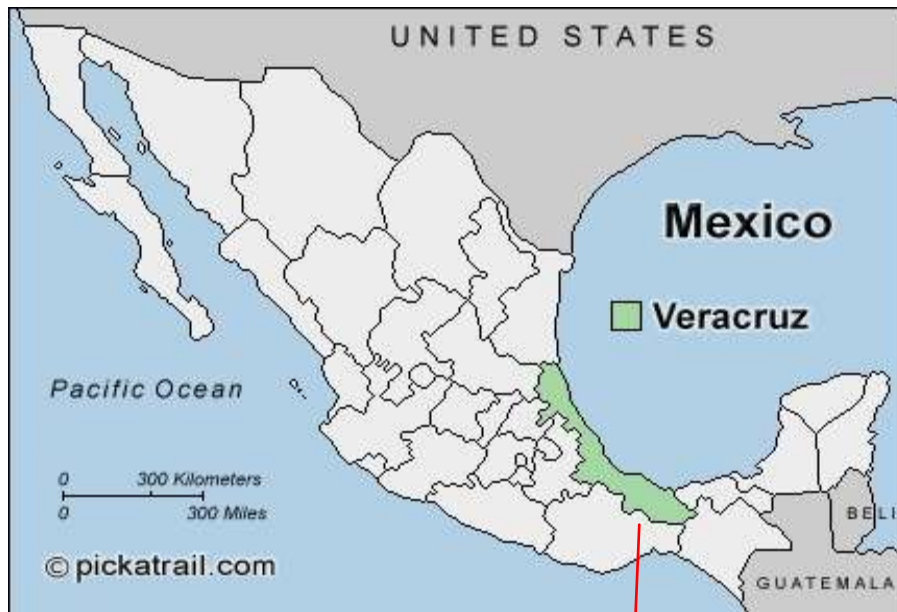
Ubicación del Estado de Veracruz (México)