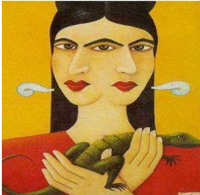
Marquardt, R., (1992) La Malinche . Latin American Portrait Gallery.

A primera vista, simboliza la agilidad y habilidad de sobrevivir; sin embargo, si tenemos en cuenta que este lagarto encarna al mismo tiempo un símbolo fálico, podríamos interpretar el gesto de la Malinche como el gesto de la dominación y autoridad sobre el hombre, la representación antagónica a la que ofrece Orozco. 70