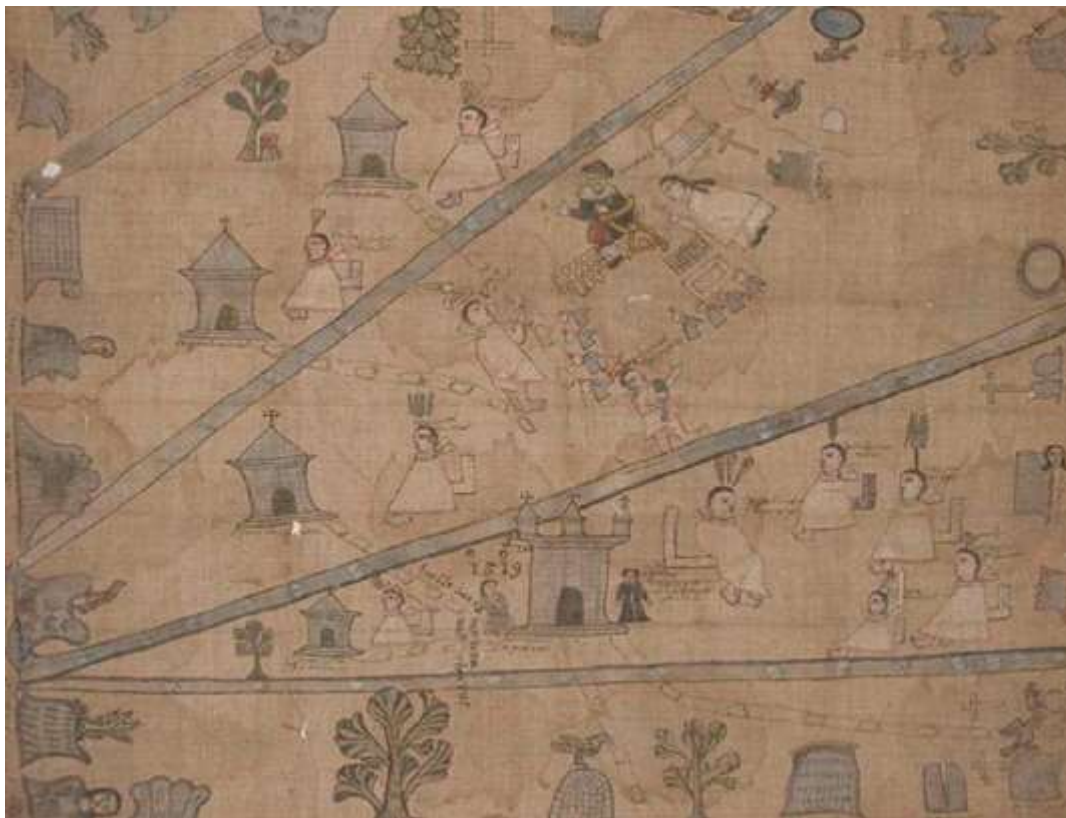
Márquez García, A., (2016) Mapa de San Antonio Tepetlán . Proyecto: Códices de Veracruz. Documentos veracruzanos de tradición pictográfica indígena. Universidad Pedagógica Nacional, México.

encuentra en el American Museum of Natural History de Nueva York. Tomando como referencia la copia situada en Norteamérica, dicho códice está fechado entre finales del siglo XVI y principios del siglo XVII, donde se dispensan los símbolos prehispánicos que hacían alusión a los 29 pueblos que lo conformaban aunque dicha distribución no parece ser fiel a la realidad geográfica, puesto que alguno de los pueblos fueron ubicados inclusive en el mar, en este documento aparece de nuevo Malinalli como bien refiere Gordon Brotherston: