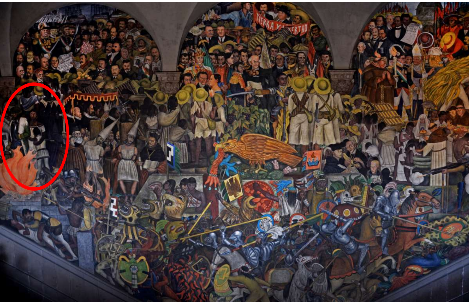
Rivera, D., (1886 - 1967) La Historia de México: de la Conquista a 1930, 1929-1931 . Fresco. Palacio Nacional, Ciudad de México

nos encontramos con la presencia de Malinalli, que Rivera mediante la luz proyectada por la hoguera, consigue captar la atención del espectador, que se topa al mirar hacia esa luz con la figura de Cortés, Malinalli y Martín.