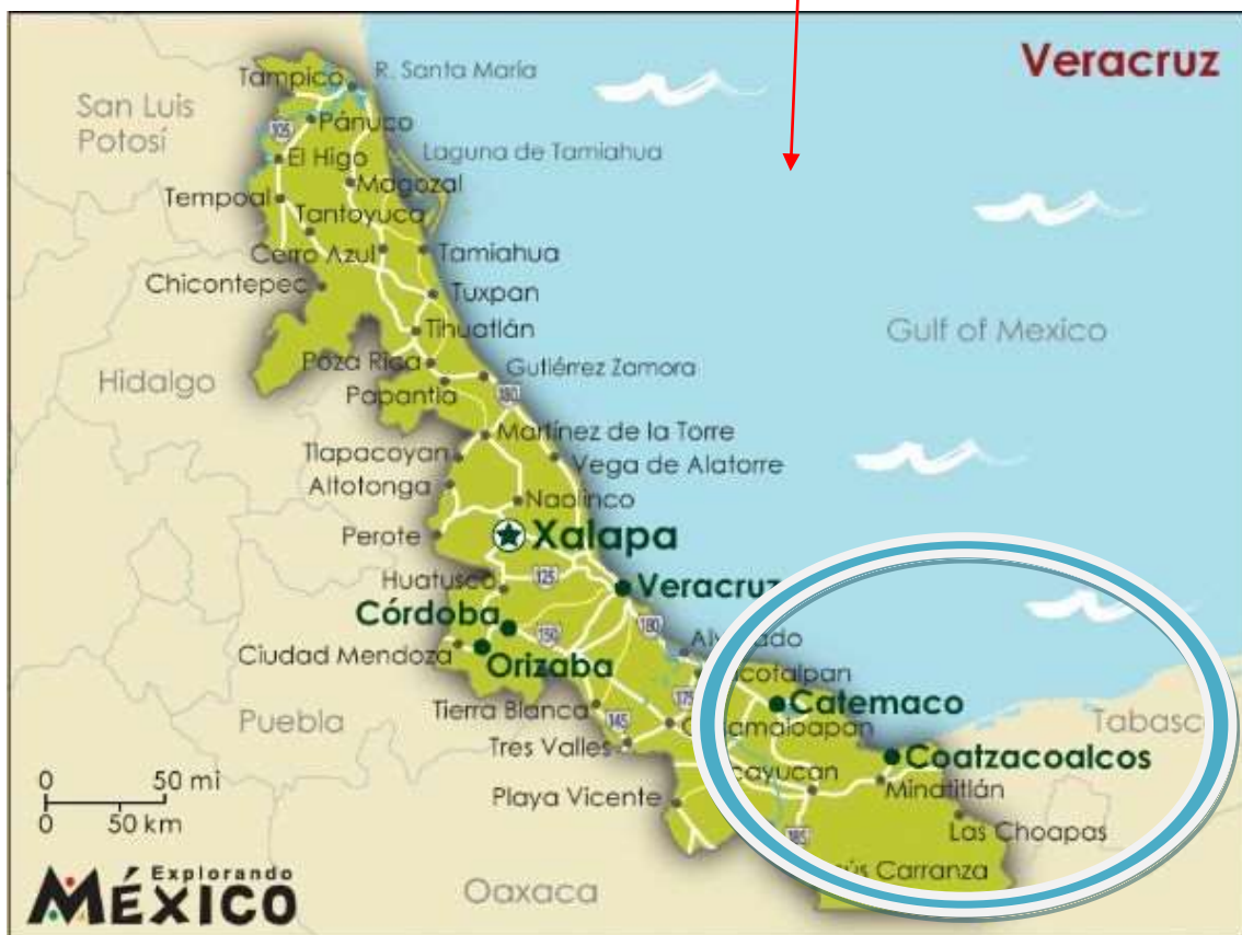
Localización del municipio de Coatzacoalcos (Veracruz)