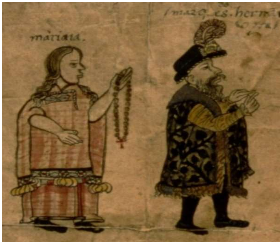
Manuscrito del Aperreamiento (1560) Fondo mexicano de la Biblioteca Nacional de Francia. Proyecto Amoxcalli Núm. 374.

En la derecha de la imagen, otros seis señores igualmente encadenados unos a otros, aguardan su turno para ser “aperreados”. En la zona superior observamos a Hernán Cortés inmóvil junto a Malinalli. Cortés levanta su mano mientras dice algo; Malinalli lleva consigo un rosario en la mano, y juntos, intentan convertir a los indígenas. Por su condición y castigo, los hombres parecen haber rechazado sus predicaciones. El primer prisionero, además, lleva una espada de tradición europea, lo cual hace nos hace sospechar que se seguramente se rebeló contra el mensaje evangelizador de Cortés. Asimismo, en esta imagen se observa perfectamente a Cortés haciendo con los dedos una “V” invertida, que quiere decir reunión, mientras que tras su figura, pero a su misma altura, Malinalli (aparece escrito Mariana) porta un rosario que extiende, lo que se puede relacionar con el motivo por el que Cortés convoca dicha reunión, en última instancia, evangelizar a los indios, objetivo que atendiendo a la representación, no habría conseguido provocando que se convirtiese en un juicio por herejía o idolatría.