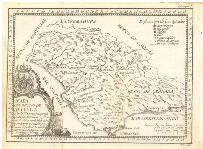
Ilustración 2. Mapa del Reino de Sevilla y parte del Reino de Granada perteneciente al tomo XIV del Atlante Español de Bernardo Espinalt. Instituto Geográfico Nacional. Catálogo de la Cartoteca. s.f. < http://www.ign.es/web/catalogo-cartoteca/resources/html/025329.html >.

En su defecto, Madoz ofrece una información mucho más completa de una forma muy sintetizada, expuestas en orden alfabético al igual que Miñano. Sus artículos presentan tanto poblaciones como ríos, arroyos, sistemas montañosos y ciudades antiguas que aparecen en los escritos grecolatinos (sobre todo de Plinio). Tapiador, Mezo y Navarro resumen muy bien el contenido del Madoz, que “... incluye información cuantitativa sobre demografía, localización, instrucción pública, beneficencia, criminalidad, procesos judiciales civiles, industria, comercio, navegación, población, caminos, riqueza territorial, e impuestos, entre otros...también incluye apreciaciones, consideraciones y descripciones de varios temas, como las gentes, el territorio, o el clima, para los lugares reseñados. Los datos básicos más comunes son los de población, situación y edificaciones 36 .”