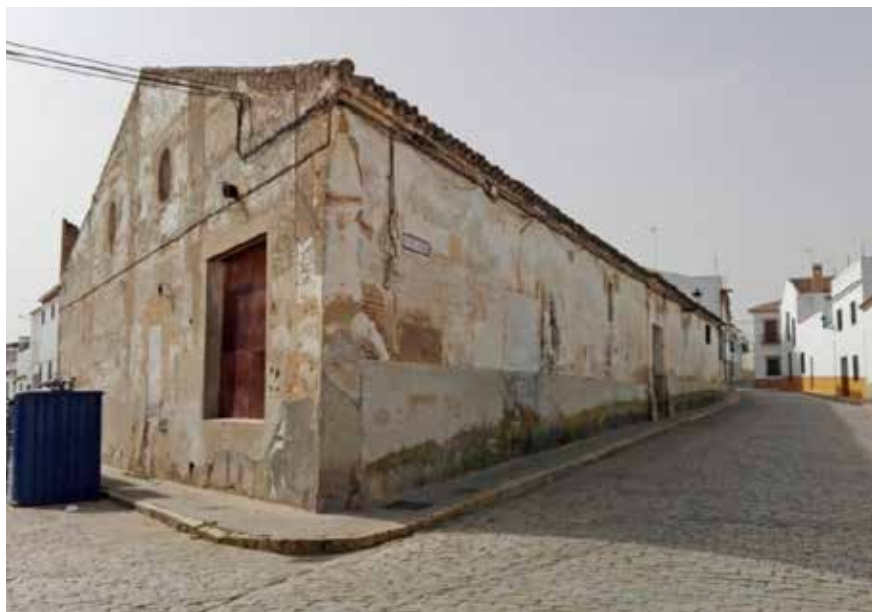
Exterior de la Bodega de las Carrionas en la antigua Plazuela de los Carriones