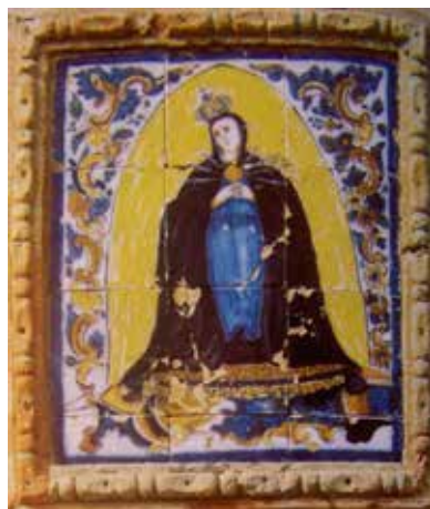
Detalles portada ampliación Bodega Grande