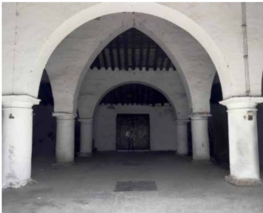
Interior de la Bodega Grande construida en primer lugar.

villa de Bollullos del Condado, el colgadizo del corral, la Bodega del corral nueva, la Bodega de las Tinajas y tintero en el corral... " 24 Si nos basamos en los restos conservados en la actualidad estos últimos elementos arquitectónicos se encontraban situados en la ampliación de la Bodega Grande.