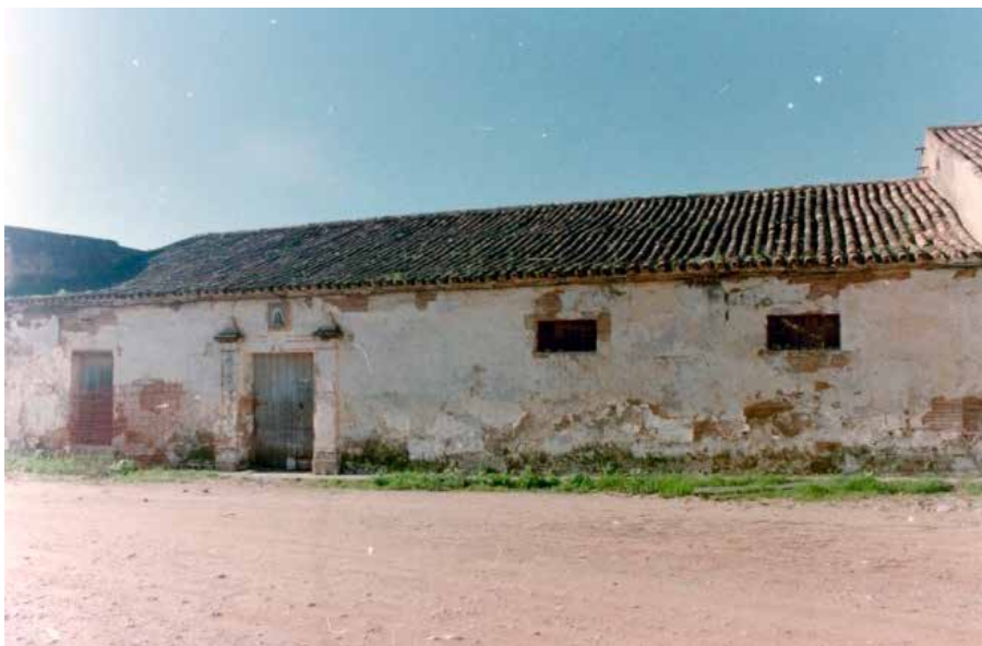
Exterior de la ampliación de la Bodega Grande antes de su deterioro

En esta primera bodega se encuentran otros espacios de fecha similar o ligeramente posterior al anterior. En primer lugar se conserva una estancia situada al final del antiguo corral formada por una nave de dos crujías dividida centralmente por arcos de medio punto. Examinando la planimetría área de la zona aparece otra dependencia que en aquella época podía formar parte integrante de la bodega, pero que hoy pertenece a la finca número 86 de la calle Padre Domínguez García y lindera con la anterior. Se trata de una pequeña bodeguilla de una sola nave dividida en su parte central por arcos de medio punto y que probablemente se encontraba integrada en el corral de la Bodega Grande.