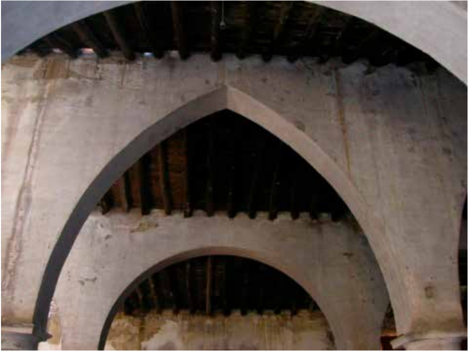
Detalle arcadas y techumbre de la ampliación de la Bodega Grande

a la época inicial de esta bodega es la llamada en los documentos Bodega Nueva del Corral , que se encuentra situada a la derecha del mismo. No tiene su acceso por la nave de entrada, sino por el corral de la bodega y está formada por una sola nave dividida en su parte central por arcos de medio punto.