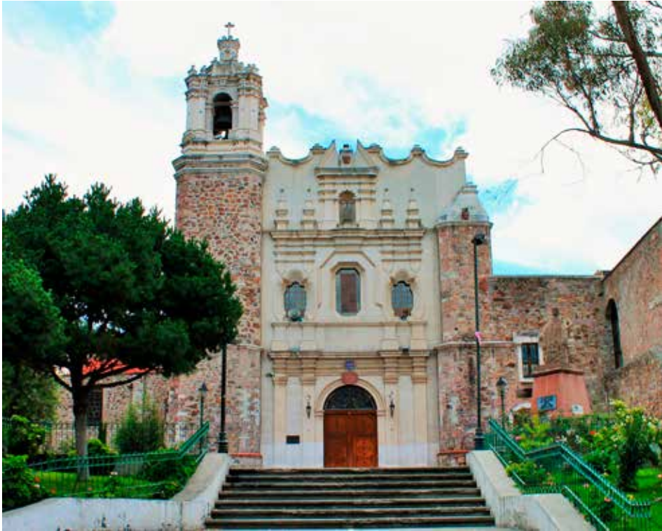
Fig. 1. Iglesia del convento San Francisco de Pachuca, desde 1732 sede del Colegio Apostólico de Propaganda Fide.

fue trasladado a pie, en un sencillo cortejo, hasta la iglesia de San Francisco del citado colegio apostólico para los funerales.