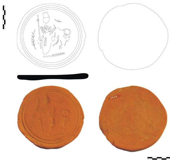
Figura 4.- Sello de panadero procedente del MNAR con representación de Ceres (nº de inventario 37514).