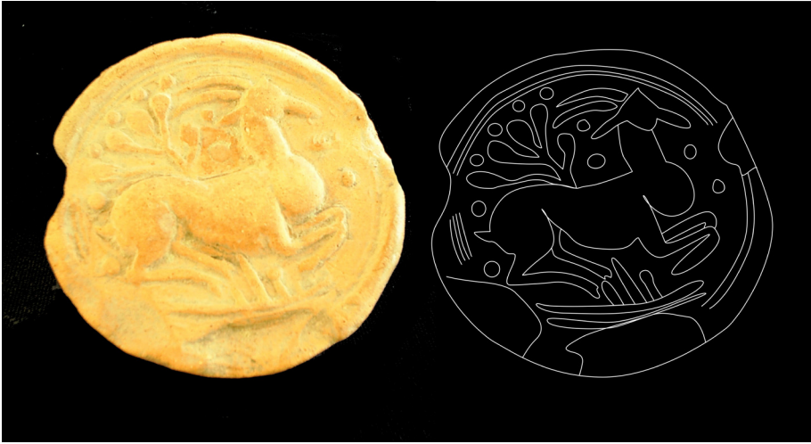
Figura 7.- Sello procedente de la Villa de los Cipreses, Jumilla (montaje a partir de foto cortesía del Museo Arqueológico de Jumilla).