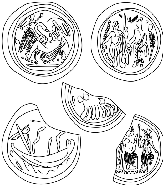
Figura 8.- Algunos de los sellos aparecidos en Córdoba (a partir de DE LO SANTOS, 1949).