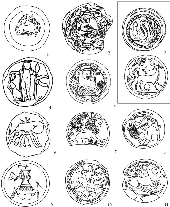
Figura 6.- Sellos de panaderos documentados en la Península Ibérica