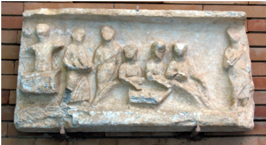
Figura 9.- Relieve de Noé expuesto en el MNAR de Mérida.