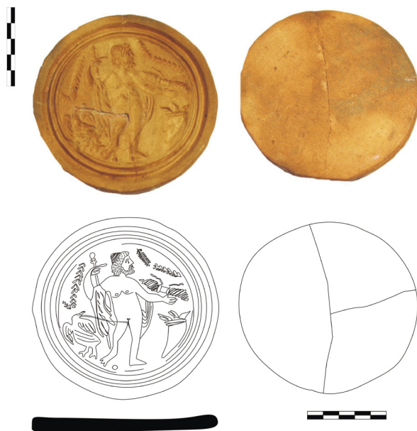
Figura 3.- Sello de panadero procedente del MNAR con representación de Júpiter (nº de inventario 17422).