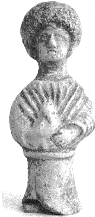
Figura 9.- Terracota aprehendiendo un posible panecillo en su mano derecha procedente de la necrópolis Norte (Mérida, Badajoz).