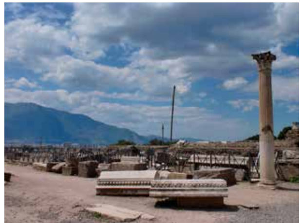
Figura 9. Templo de Venus. Foro. Civil. Foto: Autora, 2010

En el interior del muro se encontraba el templo. Al atravesar la puerta que daba acceso al complejo desde el Foro se encontraban cuatro columnas, inmediatamente después se localizaba un ara de mármol para la realización de los sacrificios, y luego nos encontramos el templo sobre un podium , al que se accedía por dos escaleras laterales y así se entraba en la cella , detrás de ésta se encontraban pequeñas estancias donde se custodiaban los objetos del templo (Fiorelli, 1875, 262; Mau, 1892, 2-3; Sogliano, 1899,