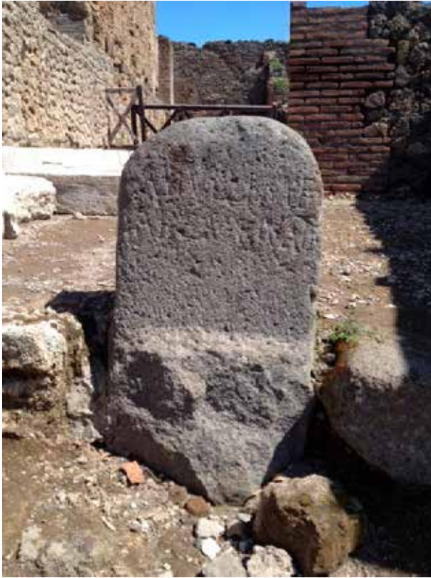
Figura 8. Terminus de Marcus Tullius . Área privada. Via del Foro.

Dentro de este recinto encontramos el templo rodeado por una arboleda sagrada, ya que en algunas ocasiones los templos contaban con pequeños espacios que aludían a los bosques sagrados que se encontraban fuera de las ciudades. Estas arboledas sagradas funcionaban como puntos de reunión de los fieles que acudían al templo (Hermon, 2017, 89) y como sistema de delimitación del espacio sagrado del templo, por lo que este templo tenía dos sistemas de demarcación.