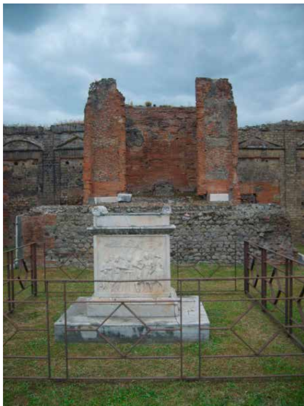
Figura 10. Templo de Vespasiano. Foro Civil.

14; Maiuri, 1950, 26; De Vos y De Vos, 1982, 41-4; Richardson, 1989, 191, Van Andringa, 2009, 51).