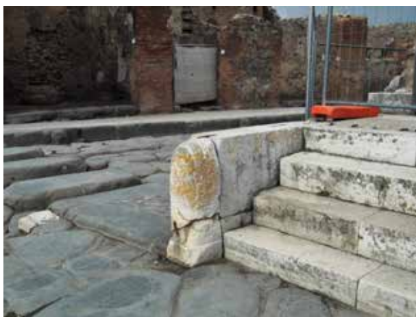
Figura 7. Terminus de delimitación. Templo de la Fortuna. Via del Foro.