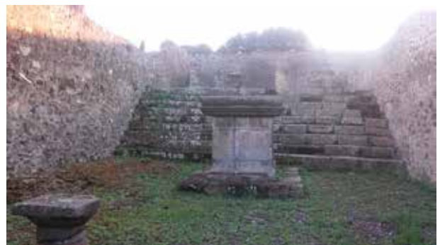
Figura 14. Templo de Júpiter Meilichios o Esculapio. Via Stabiana. Foto: Autora, 2016

Por último, el Templo de Isis estaba situado en la insula VIII.7.28 entre la palestra samnita y el templo de Júpiter Meilichios o Esculapio. Este