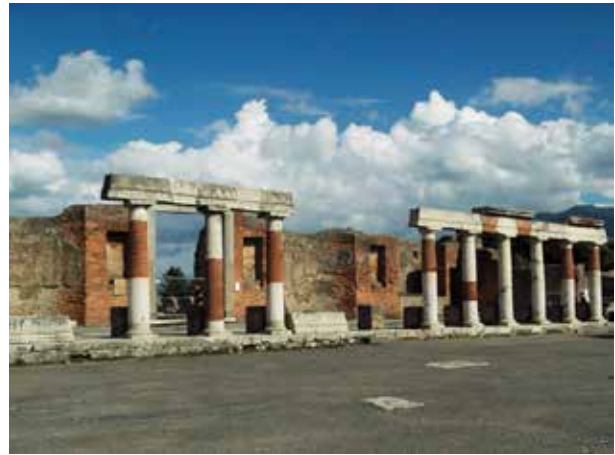
Figura 5. Columnata del Foro Civil.