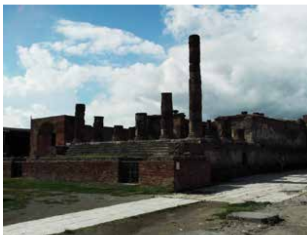
Figura 4. Templo de Júpiter. Foro Civil.