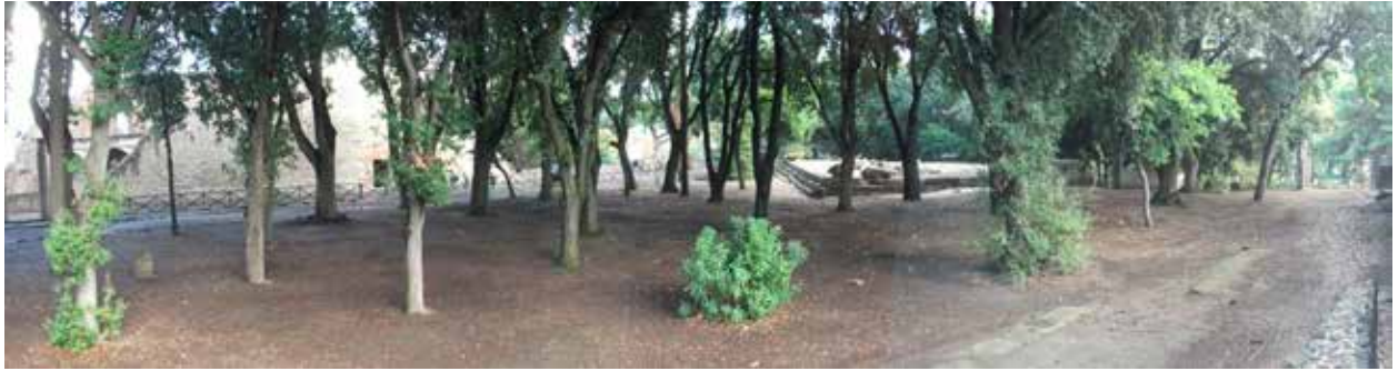
Figura 12. Templo de Hércules o Dórico rodeado de la arboleda sagrada y de la columnata del Foro Triangular. Foto: Autora, 2016

rodeado por una arboleda sagrada como sí ocurría en el templo de Venus. Sin embargo, este pequeño bosque sagrado que rodeaba al templo de Hércules o Dórico era de mayor tamaño que el del templo de Venus y tendría la misma función de lugar de reunión entre los fieles que acudían al templo y de espacio delimitador (Hermon, 2017, 89).