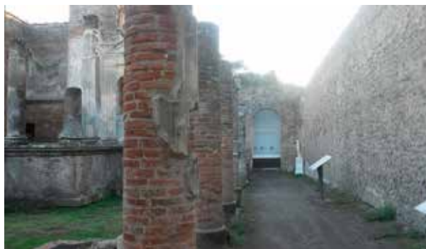
Figura 15. Situación original de la estatua de la diosa Isis y muro de delimitación del templo. Templo de Isis. 2016

decurionum ), lo que estaba cediendo era el depósito de la estatua, el uso del suelo y no el estado de la tierra. En resumen, la divinidad tenía la propiedad legal del suelo del templo, pero el Senado local determinaba su uso público, como lo hizo en el Foro Civil y en otros edificios de la ciudad que administraba como en el teatro y en el anfiteatro (Van Andringa, 2009, 99-101).