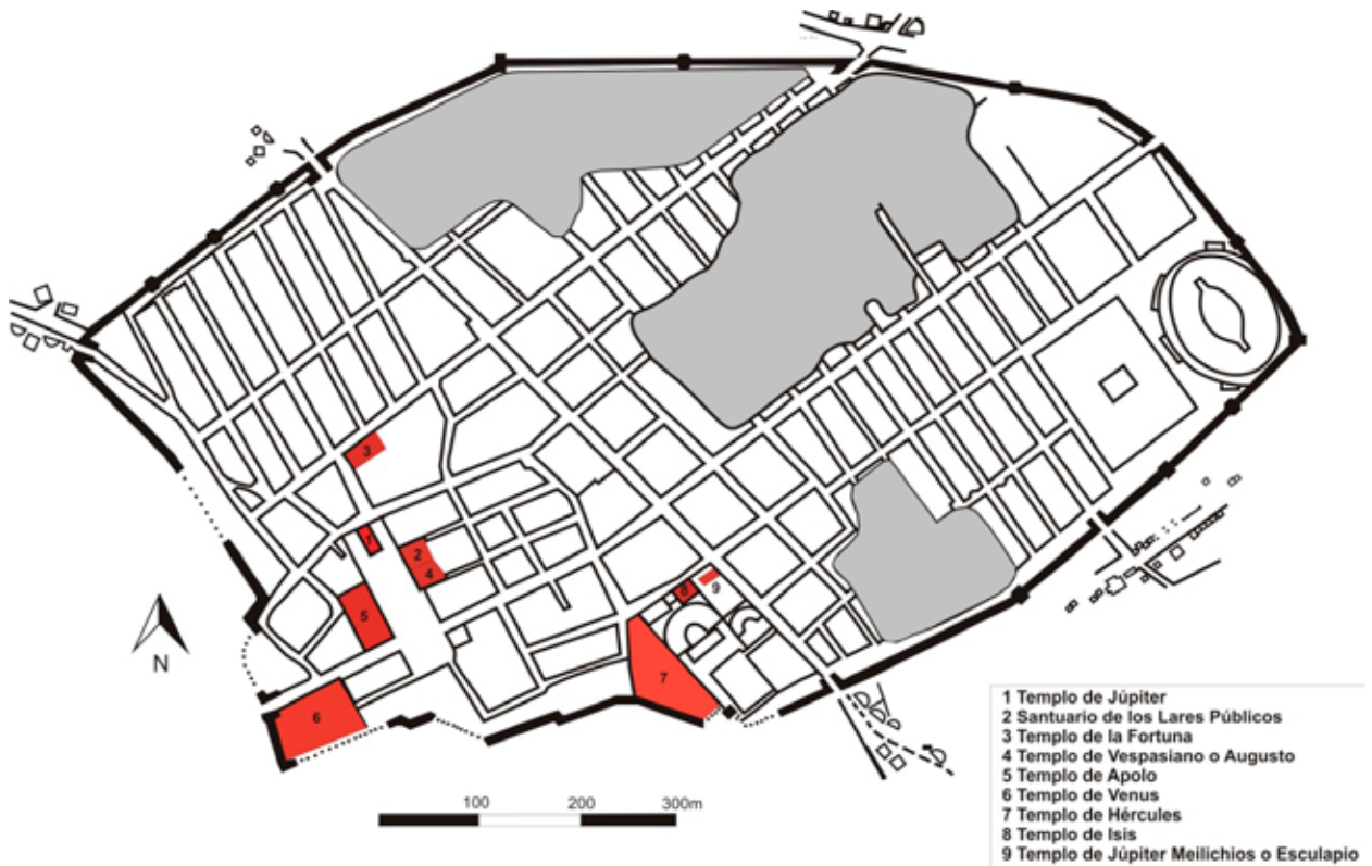
Figura 1. Distribución de los templos en la ciudad de Pompeya. Elaboración propia.

do en el Foro Triangular. El templo de Apolo se construyó en el último cuarto del siglo VI a.C. y era considerado la aedes principal de la ciudad de Pompeya hasta que se construyó el templo de Júpiter en el Foro Civil (Maiuri, 1929, 21; Etienne, 1971, 227; De Vos y De Vos, 1982, 28; La Rocca et al. , 1994, 103; De Caro, 2007, 73).