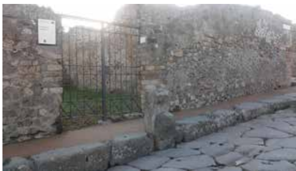
Figura 13. Muro que rodea al templo de Júpiter Meilichios o Esculapio. Via Stabiana.

A este pequeño templo se accede desde la “Via Stabiana”. Tras sobrepasar la puerta situada en el