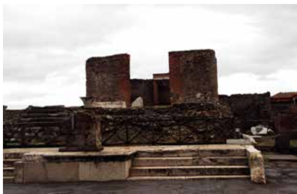
Figura 6. Templo de la Fortuna y Área privada de M. Tullius . Via del Foro. Foto: Autora, 2014

pórtico que precede a la cella revestida de mármol. La estatua de la Fortuna Augusta estaba colocada sobre una base al fondo del santuario, y en los cuatro nichos de los muros laterales ocupaban un lugar destacado las estatuas de los miembros de la familia de M. Tullius (Fig.6) (Bonucci, 1827, 145; Vinci, 1839, 90-91; Curti, 1872, 280-281; Fiorelli, 1875, 209-210; Mau, 1899, 125; Sogliano, 1899, 50; Thédenat, 1910, 66-67; Etienne, 1971, 96-97; De Vos y De Vos, 1982, 53-54; Russo, 2019, 27-28). Algunas estancias que se encontraban al Oeste del templo, entre el templo y el área privada de M. Tullius , estaban destinadas a los ministri de la diosa Fortuna. En estas estancias se encontraba una pequeña cocina. Estos ministri fueron elegidos por el constructor Marcus Tullius y eran esclavos de su confianza (Bonucci, 1827, 146; Vinci, 1839, 93; Cesare, 1845, 45; Curti, 1872, 281-283; De Vos y De Vos, 1982, 53; Russo, 2019: 28).