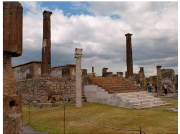
Figura 2. Templo de Apolo. Foro Civil. Foto: Autora, 2010

En la pared Oeste del santuario se encuentra una inscripción de época Augustea, año 10 a.C. aproximadamente, que hace referencia a que los duoviros