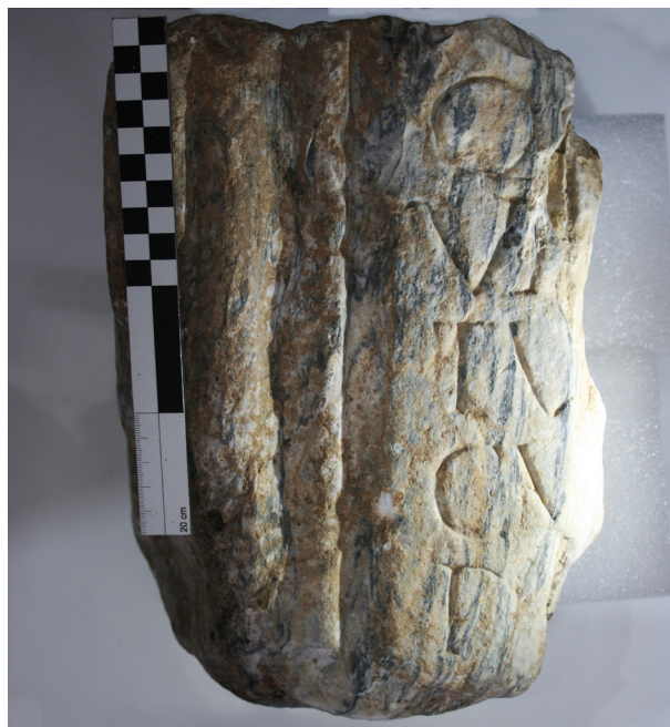
Figura 9. Fragmento de inscripción recuperada en el castillo de Aroche (2023).

de Germánico (fig. 10). La forma de la moldura, de ejecución notable, tiene un paralelo evidente con el pedestal dedicado al emperador Adriano, sobre el que sin duda habría una estatua del emperador (fig. 10). El claro paralelismo de ambos elementos, escritura y moldura, con los homenajes ofrecidos a Germánico y Adriano, que sin duda estarían expuestos en un ambiente público, probablemente en el foro del municipio, apuntan con cierta seguridad a que nuestro fragmento corresponde a un pedestal de carácter honorario.