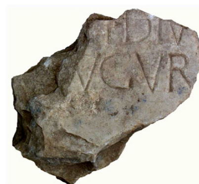
Epigrafe de Germánico