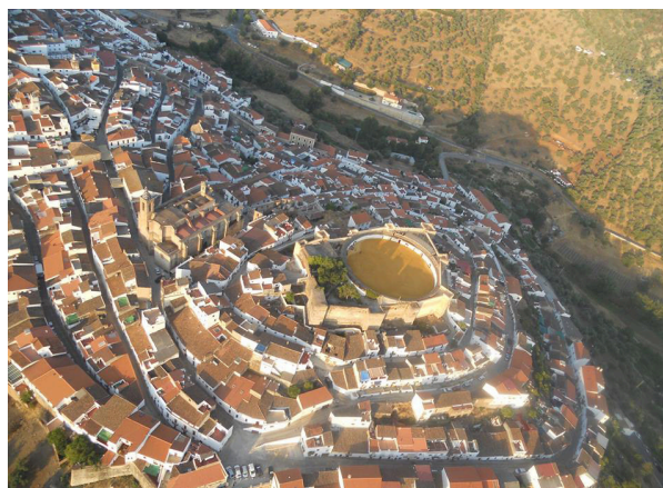
Figura 6. Vista aérea del Castillo y el casco medieval y moderno de Aroche.