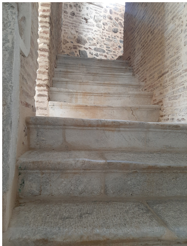
Figura 4. Detalle de la escalera principal de la Casa Palacio Conde del Álamo.

piezas de mármol claramente reutilizadas (Fig. 4), donde es posible aún ver restos de inscripciones, ya ilegibles, o piezas con huellas donde se insertarían las grapas o anclajes. No obstante, la acción del conde no fue un hecho aislado, como demuestra por un lado la intervención arqueológica de 1999 en Arucci , cuando un vecino de la localidad, describió el lugar del cual pocos años antes había extraído una gran cantidad de ladrillos para su reutilización en la obra de su vivienda. Toda esta información sobre aprovechamientos de material y reutilizaciones a gran escala ha sido posible gracias a los seguimientos de obra y mantenimiento del patrimonio desarrollados desde la oficina técnica municipal.