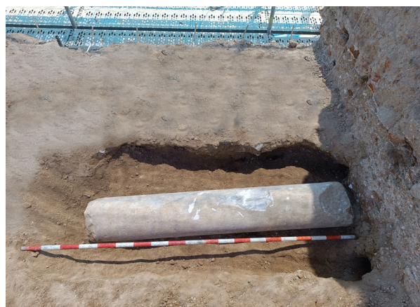
Figura 8. Nuevo fuste de columna documentado en el castillo (2024).

Centrándonos de nuevo en el hallazgo que motiva este trabajo se trata de un fragmento de epígrafe elaborado en el característico mármol local, de grano medio y vetas grises-azuladas, característico de las formaciones marmóreas pertenecientes a la