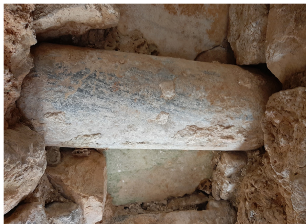
Figura 5. Fragmento de columna empotrada en la fábrica moderna-contemporánea del castillo.

Así, un análisis detallado del castillo permitió documentar nuevas piezas reutilizadas de la ciudad romana, como fustes de columnas (Fig. 5), sillares, ladrillos o incluso fragmentos de muros que aún conservan restos de estuco. Este acarreo y reaprovechamiento masivo se corresponde con la construcción en el interior del castillo, de una plaza de toros (Fig. 6), una gran reforma llevada a cabo en 1802 que debe ser la responsable de la reutilización de esta nueva inscripción que motiva el presente trabajo.