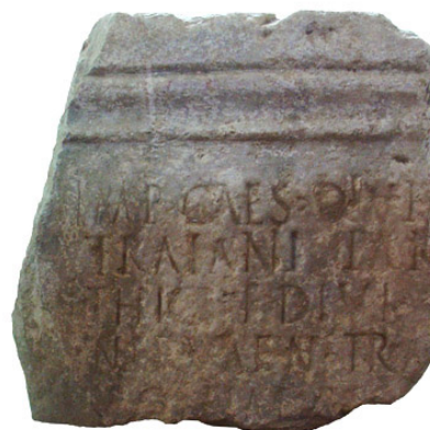
Epigrafe de Adriano

l.2: VA: si la interpretación de la l.1 es correcta, entonces VA debería corresponder a un cognomen, probablemente iniciado por dicha sílaba: Valerianus , Valentinus , Valens , etc.