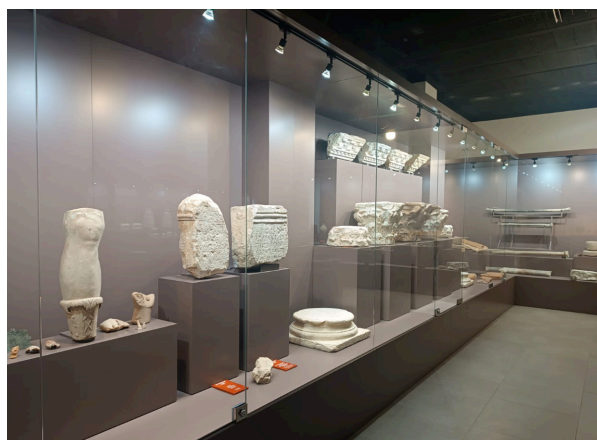
Figura 2. Vista general de la Colección Municipal.

La documentación de piezas ya fuese en obras, movimientos de tierra o trabajos agrícolas motivó la creación en 1958 de un museo local, hoy regularizado como Colección Arqueológica Municipal. En ella se depositaron numerosas piezas provenientes de la ciudad romana de Arucci, que comenzará su período de abandono funcional a inicios del s. III d.C., seguido de un abandono habitacional ya en las postrimerías del s. IV (Campos y Bermejo, 2013), momento a partir del cual da inicio su mencionado uso como cantera de materiales de construcción. El expolio sufrido tuvo como objeto la reutilización de mármoles, granitos, piedras varias o ladrillos, estos últimos muy codiciados en las nuevas construcciones del actual Aroche, o bien para la fabricación de cal a través del mármol y resto de calizas del yacimiento ya desde época tardoantigua a través de officina spolia .