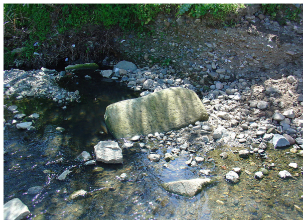
Figura 3. Sillares en el cauce del río Chanza, aguas debajo de la ciudad de Arucci.

el poder adquisitivo de sus propietarios con enterramientos turriformes, sarcófagos de plomo, mosaicos o cerámicas de importación, corroborando la transformación y cambio del mundo urbano, desde la civitas a una ruralización cada vez más significativa. Todos estos yacimientos, mantienen una conexión con el territorio ya que se localizan cerca o junto a la vía que pasando por Arucci llegaría a Pax Iulia (Ruiz, 2004). También se constata la presencia de vici que pudieron asumir la centralización y redistribución de la producción agropecuaria y en torno a los cuales se desarrollarían posteriormente pequeñas aldeas, como el caso de Las Cefiñas. Por último, en ese proceso de ruralización, volverá a documentarse ocupación en antiguos castros despoblados con la política de contributio de Roma, como se desprende de la ocupación tardoantigua en Las Peñas, Miradero o Los Benitos (Pérez, 1987; Campos et al. 2003)