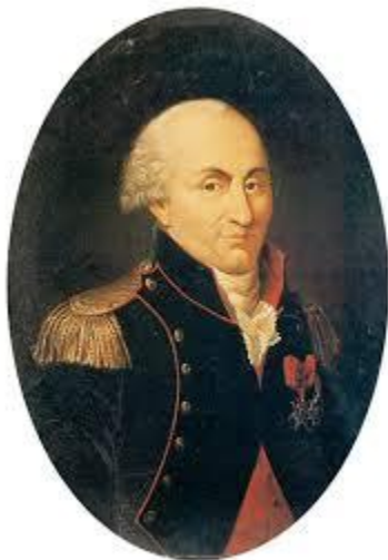
Figura 1. Retrato de Charles-Augustin de Coulomb

En su honor, la unidad de carga eléctrica lleva el nombre de culombio (C).