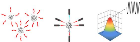
Fig. 1: Esquema de la evolución de un sistema con ruido térmico hacia la unificación de las funciones de onda en un estado coherente. (Transición de fase cuántica)

Efecto de “melaza” óptica. Esta interacción genera una fuerza siempre opuesta al vector velocidad, simulando la resistencia de un fluido viscoso. Como se detalló en la sección 4, esta minimización del momento lineal expande la longitud de onda de Broglie del átomo, facilitando el solapamiento de las funciones de onda y el inicio de la condensación. 3