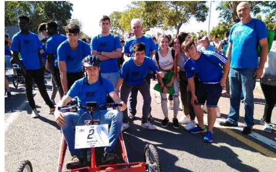
Algunos equipos participantes