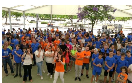
Asistentes y participantes