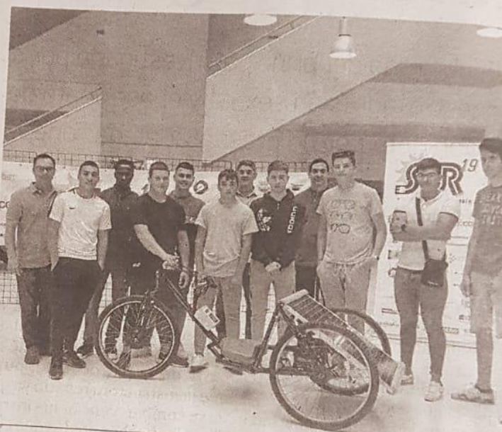
Uno de los prototipos que participarán mañana en la prueba.

Asimismo, SUR19 cuenta con el patrocinio de múltiples empresas e instituciones, entre las que se encuentra la propia Universidad de Huelva y su Consejo Social, el Ayuntamiento de Palos de la Frontera, el Colegio Oficial de Peritos e Ingenieros Técnicos Industriales de Huelva, la Fundación Atlantic Copper y la Fundación Cepsa, las Cátedras de Aguas de Huelva y de Aiqbe, y las empresas Kassel, Bonafrú y Driscoll's.