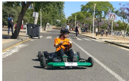
Prototipos y pruebas