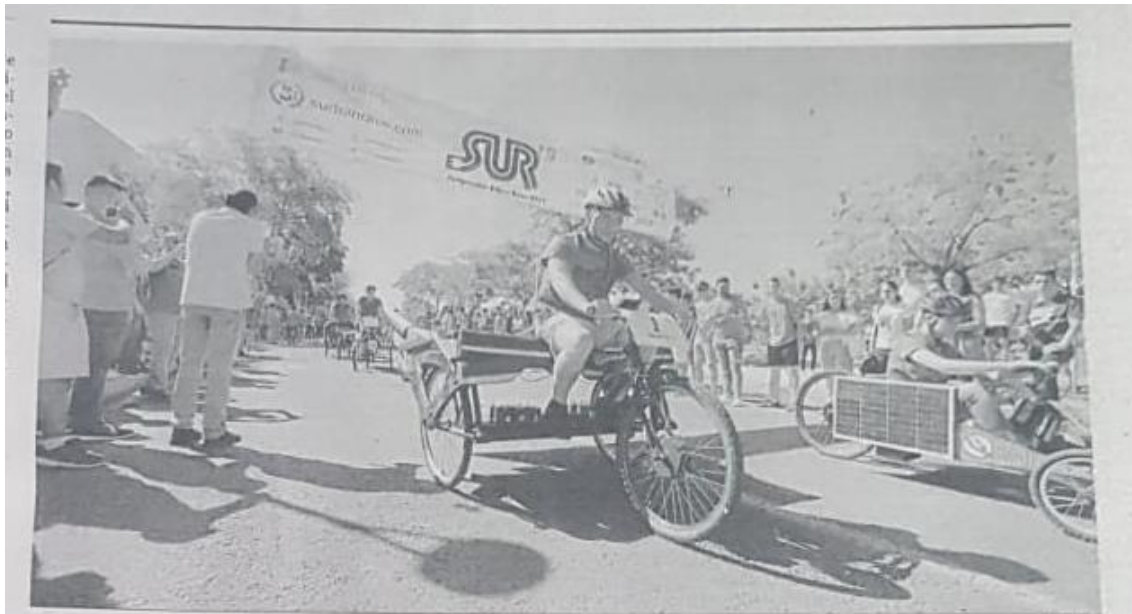
La carrera se desarrolló en el Campus del Carmen.