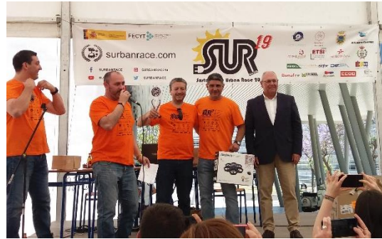
Entrega de premios