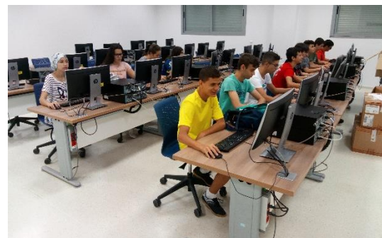
Bienvenida y charla técnica